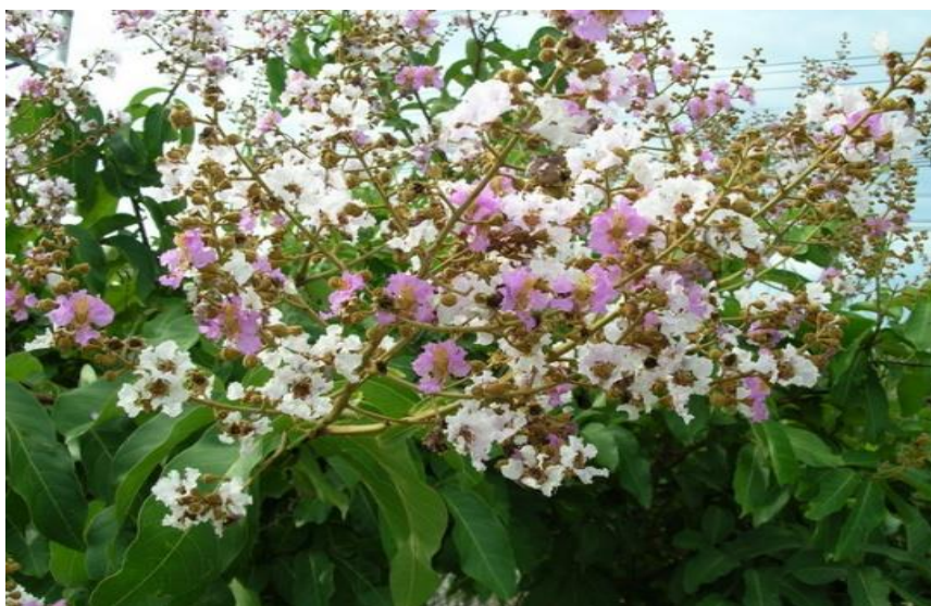
ต้นตะแบก